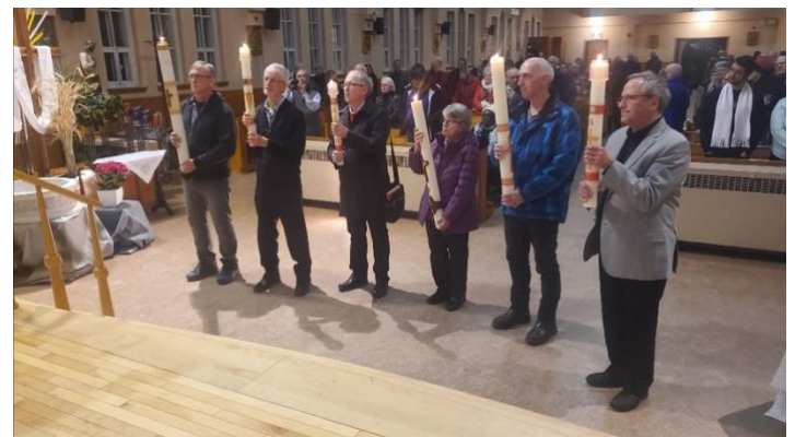
Vigile Pascale, église St-Roch